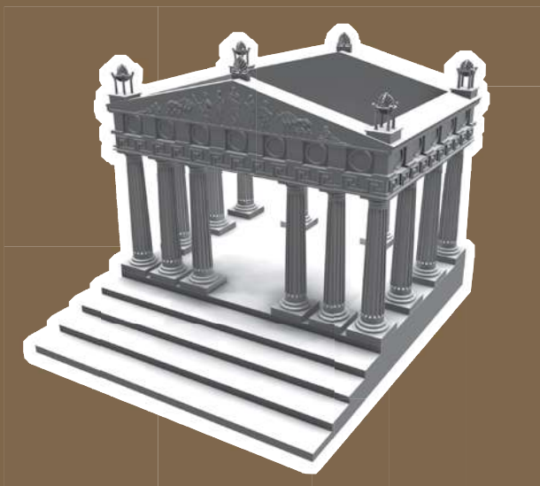
Reconstitution d'un temple grec sur l'esplanade Delayen pour accueillir la Flamme Olympique

Afin de célébrer le passage de la Flamme Olympique, le 10 mai 2024, Saint-Raphaël va remonter le temps et se transformer en une cité de la Grèce antique.