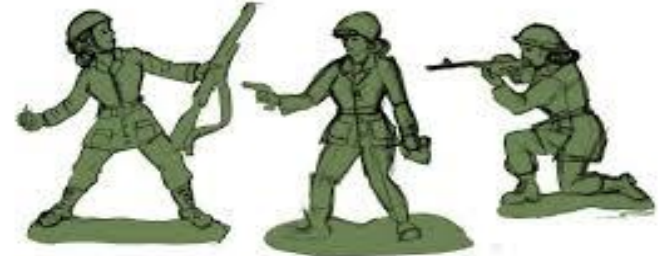
BMC Toys® Plastic Army Women © BMC Toys

En 2020, grâce à l'intervention d'une Américaine de 6 ans, des nouveaux modèles de petits soldats en plastique vert débarqueront dans les magasins de jouets : des figurines de femmes .