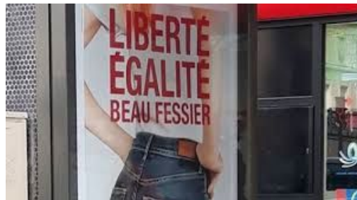
“Seine-Saint-Denis: Le maire des Lilas fait retirer la pub «liberté, égalité, beau fessier» jugée sexiste” 20 minutes 8 mars 2019