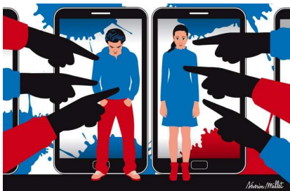
“Violences sexistes à l'école : les garçons sont aussi des victimes” Le Monde 31 mai 2018