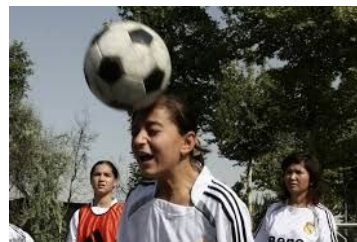
Tarn : 86 joueuses de foot quittent leur club à cause de comportements sexistes RTL 25 septembre 2019