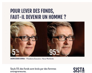
S'il suffit de quelques poils de barbichette ou des cheveux courts pour obtenir des fonds, les entrepreneures retouchent leur photo. Les nouvelles news 24 septembre 2019