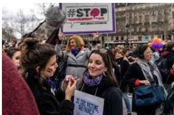
En un an, 713 contraventions ont été dressées en France pour « outrage sexiste » dans la rue ou dans les transports. La Croix 5 août 2019